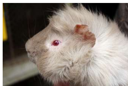
Grenadine fait partie de la ménagerie

En attendant le développement de son activité, des enfants chanceux ont déjà eu le privilège de monter dans le sulky tiré par Wera la puissante shetland isabelle.